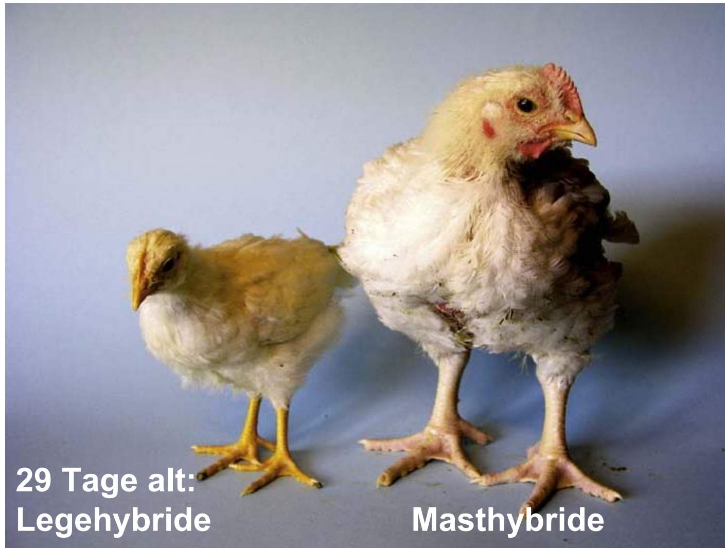
29 Tage alt: Legehybride